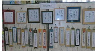
昨年の文化祭の作品展