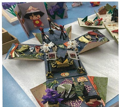
5月に展示されたあじさいの会の作品

2階ギャラリー展示希望者を募集しております。 連絡先 田尻交流センター 電話(42) 15552