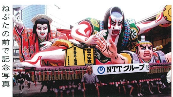
ねぶたの前で記念写真