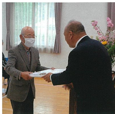
感謝状を受ける下相田第2団地児童公園草刈り隊代表者

本団体は、長年にわたり、有志により公園及び周辺の草刈りを行い、環境美化活動に貢献している。