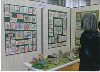
絵手紙の展示様子